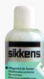
Gel Hidratante Sikkens